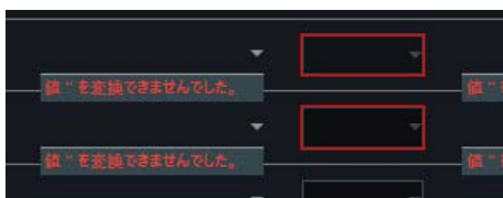
画面表示が正しくない場合